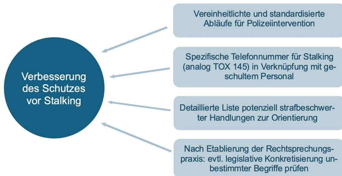
Abbildung 5: Zusammenfassende Darstellung, Schutzempfehlungen (eigene Darstellung, 2025)

Insgesamt zeigt sich, dass der Schutz vor Stalking ebenfalls durch organisatorische, kommunikative und praxisorientierte Massnahmen verbessert werden kann. Während das Gesetz selbst derzeit ausreichend flexibel und zukunftstauglich erscheint, besteht sowohl bei den Strafverfolgungsbehörden als auch im Bereich der Information und Prävention ein klarer Bedarf an strukturierten Abläufen, spezialisierter Betreuung und breiter Sensibilisierung. Diese Kombination ermöglicht es, Betroffene frühzeitig zu erreichen, Täter konsequenter zu konfrontieren und den neuen Straftatbestand wirksam zur Anwendung zu bringen.