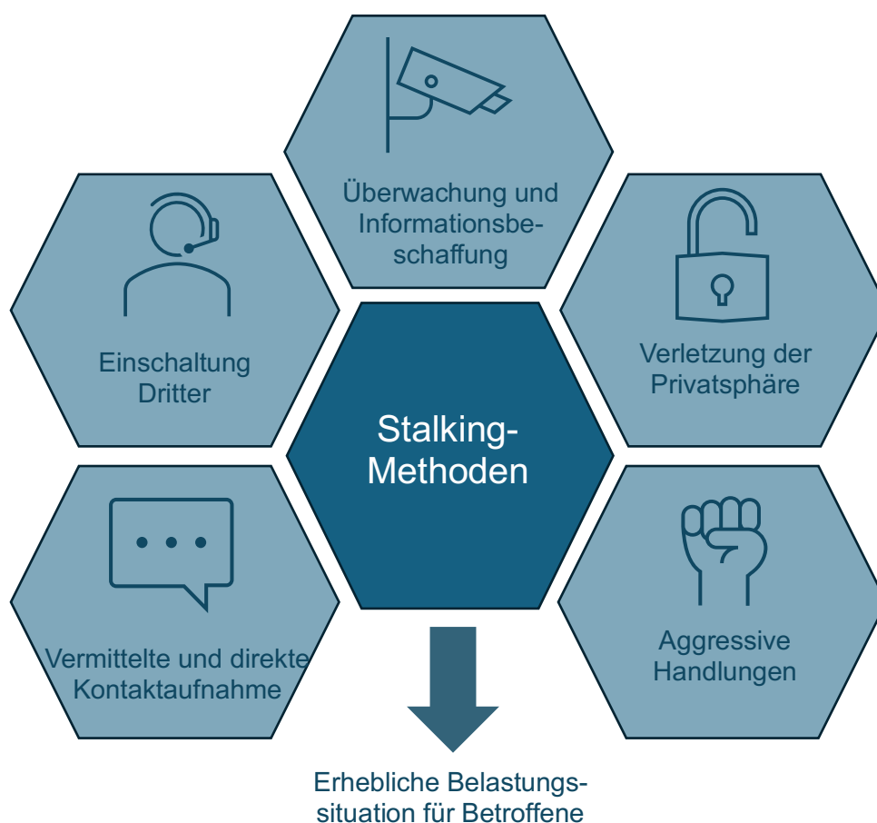
Abbildung 2: Graphische Darstellung verschiedener Stalking Methoden (Eigene Darstellung, 2025)

Um die Vielfalt der eingesetzten Handlungen systematisch zu erfassen, lassen sich Stalking-Methoden zusammenfassend in verschiedene Kategorien unterteilen, die typische Verhaltensmuster und Handlungen der Täter verdeutlichen (McEwana Troy E., 2020; Morgan Rachel E., 2022; Zimmerlin, 2011).